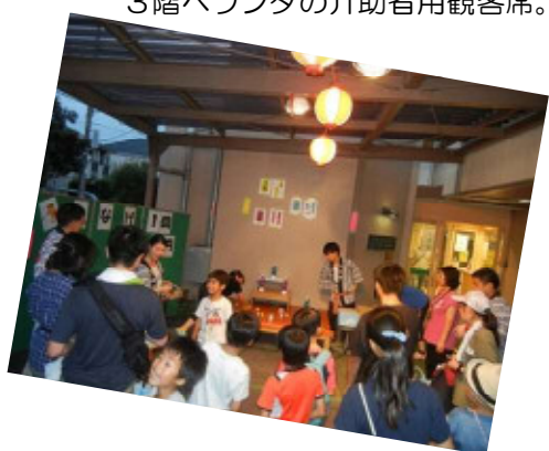
輪投げゲームでは子供たちの笑いと歓声が