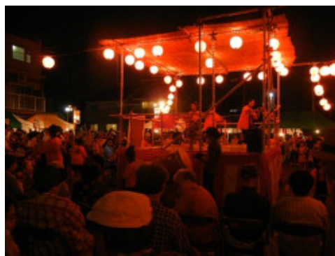
やぐらを回り、「東村山音頭」の盆踊り