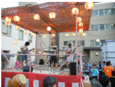
西多摩社中の演奏。地域の方から「素敵な音楽ですね！」の声も。