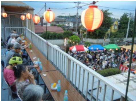
3階バルコニーの介助者用観客席。外の風に当たって、お祭りを楽しみました。