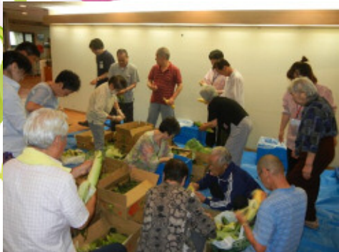
沢山の方にお手伝い頂き、あっという間にとうもろこしの皮むきを終わりました。今年も焼きトウモロコシ、飛ぶように売れました！

社会福祉法人 東京蒼生会 万寿園・第三万寿園 広報委員会発行 Tel 042-391-2578 E-mail manjuen@poppy.ocn.ne.jp