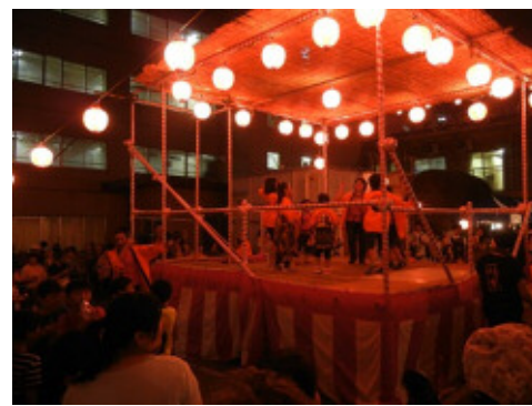
どんこい魂の子供たちによる「よさこい」 っこしょ〜！