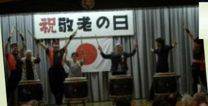
9月 敬老祝賀会和太鼓