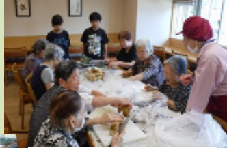
8月 第3中分校からいただいた ジャガイモの芽とり