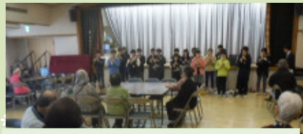
12月 南台小学校6年生交流