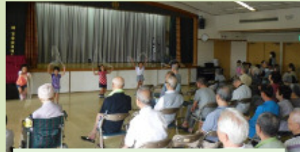
9月 つぼみ保育園との交流

*お楽しみ食* *鍋焼きうどん *すきやき *お寿司 好きなお食事を 選んで食べました