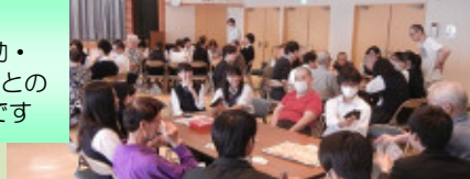
東村山西高校1年生交流 全7回、総計210名の高校生来園