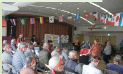
11月 秋の万寿園大運動会