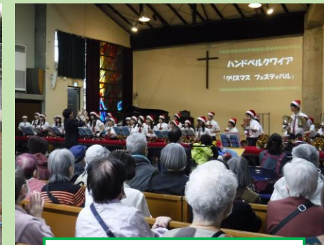
明治学院クリスマス会