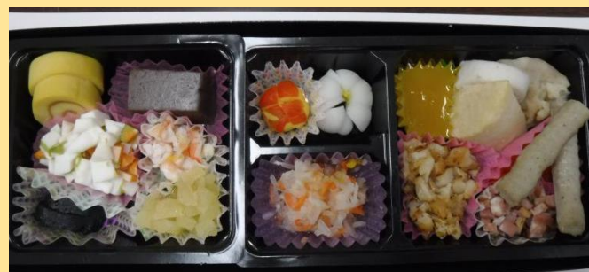
大きさ変更や柔らかい食材に置き換えた膳