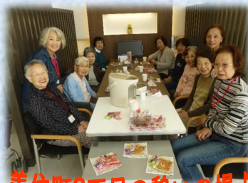
美住町2丁目の憩いの場♪