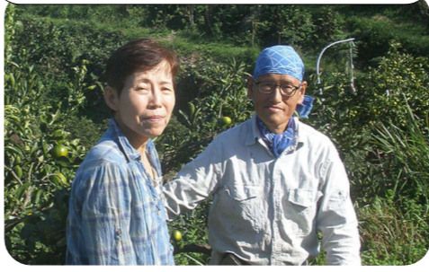
大量収穫♪はいチーズ♪