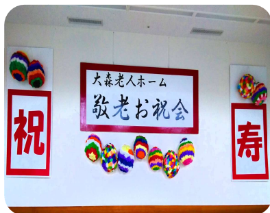
集会室・会場の飾り付け