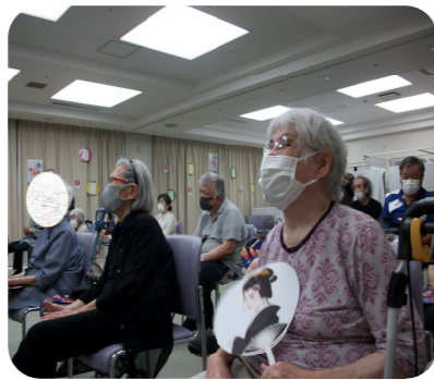
職員手作りの『白さん応援団扇』をもって観覧♪

直前まで感染者が出ていた状況もあり、まだ声を出しての声援を送ることができませんでした。今回は観覧席中央に花道を作り、白さんの艶姿をより近くで見ることができました。