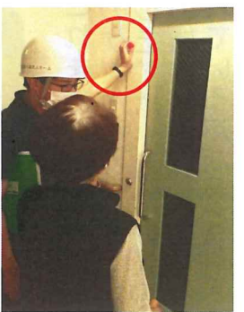
職員が、赤いマグネットを移動

居室前の「赤いマグネット」の使い方について改めて説明します。災害時（地震や火事など）、ご利用者様が居室から安全な場所に避難されたか、職員間で一目で分かるよう、左の写真のように職員が赤いマグネットを移動させています。※避難状況の確認と把握に必要なためです。